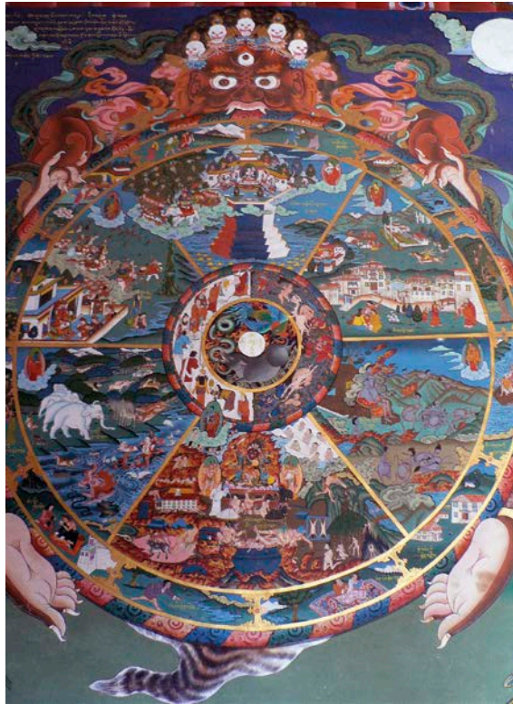
La roue du Samsara présente les six classes d'êtres qui existent selon le bouddhisme. Cette thangka traditionnelle est un support de méditation pour nous rappeler que nous pouvons basculer d'une classe d'être à l'autre, en fonction de notre karma, si nous n'avons pas encore atteint l'état de Bouddha.

animistes préexistantes. Le bouddhisme n'est pas seulement une philosophie donc, mais aussi une mise en pratique qui dépayse, qui bouleverse.