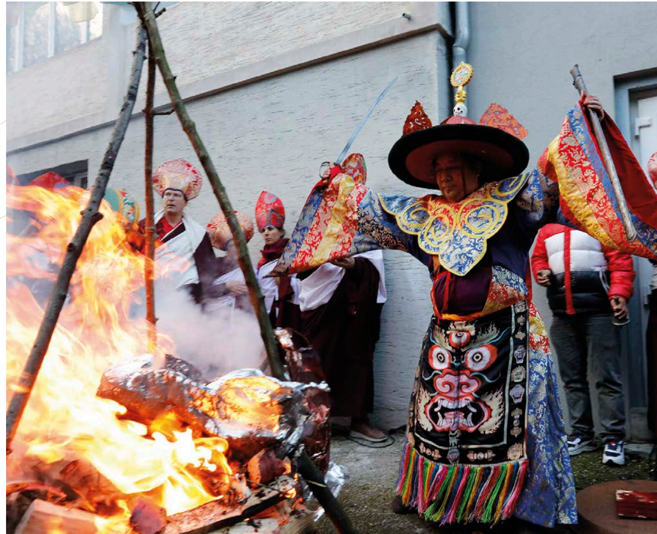
Lors d'un rituel traditionnel proche du chamanisme, le lama (ici, Namkha Rinpoche), chargé d'un costume qui signifie qu'il devient, pour l'occasion, prend le nom de Dorje Drolö. Il effectue une danse autour d'un feu chargé de brûler ce qui peut nuire, d'une quelconque façon, aux participants du rituel, en particulier notre propre saisie égocentrique. Le but demeure toujours de purifier le karma.