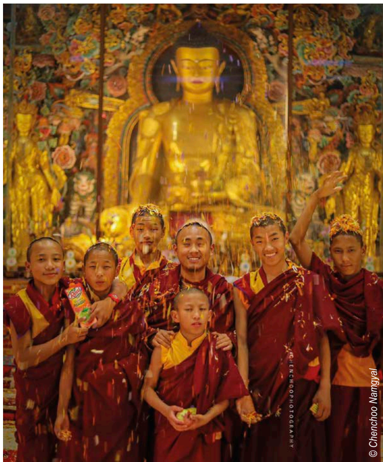
Les moines du monastère de Sechen, au Népal.

Pionnier de la méditation et de la pleine conscience, avant même que ces concepts ne fussent élaborés en Occident et vulgarisés par certaines applications, le bouddhisme tibétain s'est construit sur le principe de la connaissance de notre propre esprit, en tant que condition sine qua non de connaissance du monde. Nul besoin de chercher à l'extérieur de soi la solution à nos problèmes, car tout est intérieur. Il ne s'agit pas pour autant de nier que telle personne peut par exemple chercher à nous agresser, que telle maladie chronique nous fait souffrir, mais de commencer par prendre conscience que ce que je vois est, avant tout, le reflet de mon propre esprit, de mes émotions, de mes croyances. Ce simple prédicat est déjà, en soi, révolutionnaire dans un monde où nous nous affairons à étudier les sciences, l'histoire, la politique, le fonctionnement du corps humain, où nous scrutons les comportements des uns et des autres. Nous n'avons jamais pensé que nous en apprendrions peut-être plus en regardant celui qui regarde, en tournant notre projecteur intérieur sur ce qui va, en nous, à la vitesse de l'éclair, d'une pensée à l'autre, d'une émotion à la mise en action de celle-ci. Je pense à une tablette de chocolat, l'envie surgit, je me précipite pour aller la chercher dans